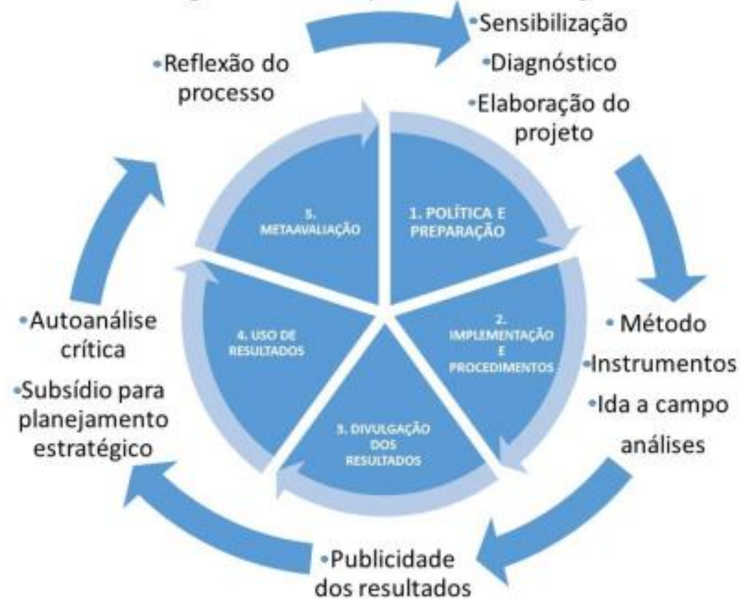
Figura 1. Ciclo do processo de avaliação.